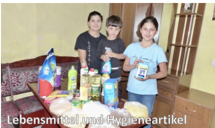
Lebensmittel und Hygieneartikel